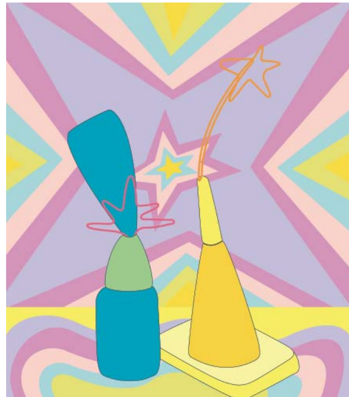
Foglie e fiori con universo disegno / drawing, 2008