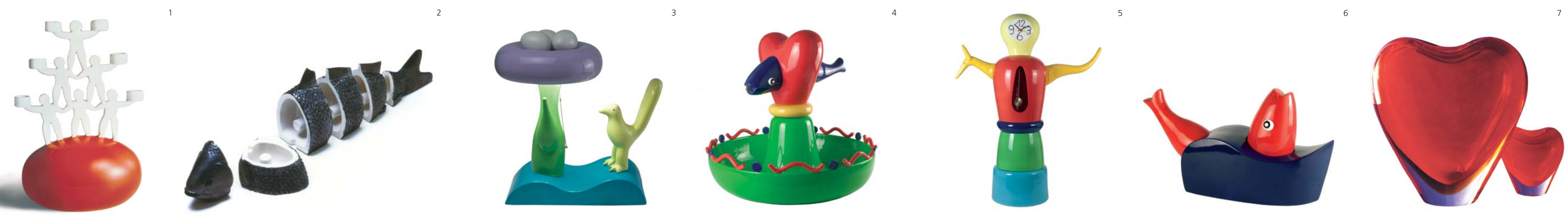
1 Evviva , candelieri / candle holder, pezzo unico / unique piece, 1995 2 Pesh-tray , posacenere / ash tray, ceramica / ceramics, pezzo unico / unique piece, 1986 3 Home sweet home , lampada / lamp, ceramica / ceramics, edizione limitata / limited edition, SuperegoEditions, 2009, photo emanuelezamponi.com 4 Fish Heart , fontana / water fountain, ceramica / ceramics, edizione limitata / limited edition, SuperegoEditions, 2009, photo emanuelezamponi.com 5 O'clock , orologio / clock, ceramica / ceramics, edizione limitata / limited edition, SuperegoEditions, 2009, photo emanuelezamponi.com 6 Giona , scultura / sculpture, ceramica / ceramics, edizione limitata / limited edition, SuperegoEditions, 2009, photo emanuelezamponi.com 7 Cuore , vaso / vase, vetro / glass, Salviati, 1995