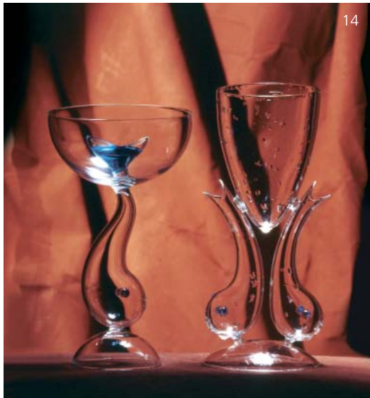
8 Fiore , scultura luminosa / light sculpture, ceramica e neon / ceramics and neon, edizione limitata / limited edition, SuperegoEditions, 2008, photo Marisa Chiodo 9 Vaso , scultura luminosa / light sculpture, ceramica e neon / ceramics and neon, edizione limitata / limited edition, SuperegoEditions, 2008, photo Marisa Chiodo 10 Geyser , scultura luminosa / light sculpture, ceramica e neon / ceramics and neon, edizione limitata / limited edition, SuperegoEditions, 2008, photo Giampietro Agostini 11 Amore e Sentimento , totem, ceramica smaltata / glazed ceramics, edizione limitata / limited edition, SuperegoEditions, 2008, photo Giampietro Agostini 12 Paradiso terrestre , totem, ceramica smaltata / glazed ceramics, edizione limitata / limited edition, SuperegoEditions, 2008, photo Giampietro Agostini 13 Zebra a Pois , colonne e fontana / columns and fountain, ceramica smaltata / glazed ceramics, pezzo unico / unique piece, 1992, photo Eugenio Bersani 14 Pesce Balena e / and Pesci Piccoli , bicchieri / glass, borosilicato / borosilicate, Muksi, 2009

In copertina / On the cover, photo Marisa Chiodo Stella e / and Foglia , sculture luminose / light sculptures, ceramica e neon / ceramics and neon, edizione limitata / limited edition, SuperegoEditions, 2008 al centro / in the middle Amore e Sentimento , lampada / lamp, edizione limitata / limited edition, SuperegoEditions, 2008